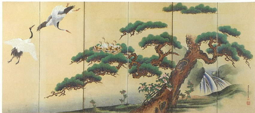
蓬萊図屏風(右隻) / 狩野林泉