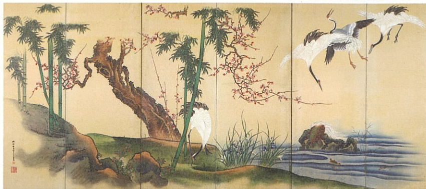
蓬萊図屏風(左隻) / 狩野林泉