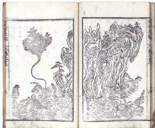
山海経(海内北経より蓬萊の図)